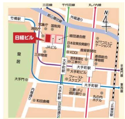
地下鉄「大手町駅」下車 C2b 出口直結、「竹橋駅」下車 4 出口